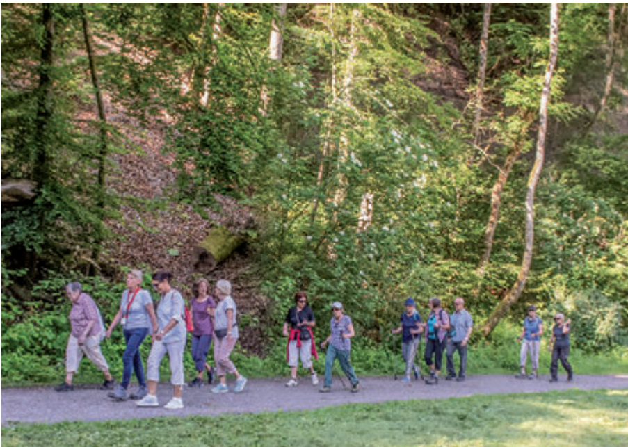
ZÄMEGOLAUFE-Gruppe Wetzikon auf Parcours 6 (Chämtnertobel)